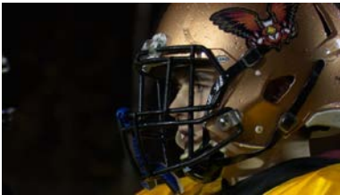
Un joueur des Griffons

Le programme de football de la polyvalente C.E. Pouliot a fait beaucoup de chemin depuis ses débuts, il y a six ans. À leur première partie, les Griffons avaient reçu une correction de 52 à 0 contre les Guerriers de Rivière-du-Loup, qu'ils affrontent en finale cette année. Cette école offre un programme sport-études en football.