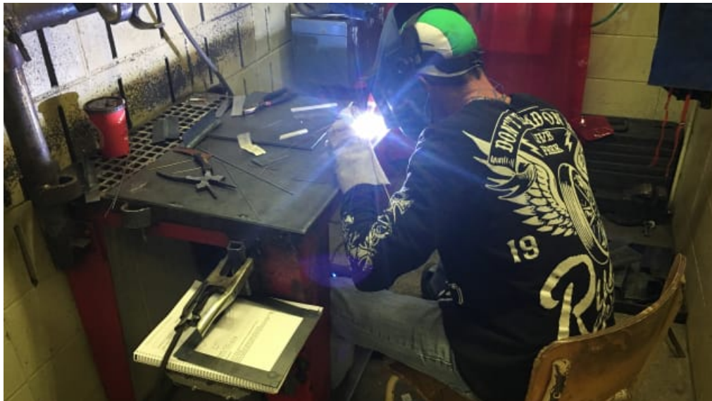
Élève du programme de Soudage-montage au Centre de formation professionnelle de la Côte-de-Gaspé

Le Centre de formation professionnelle de la Côte-de-Gaspé souhaite se démarquer avec ces équipements uniques pour attirer de nouveaux élèves. Le programme accueille cette année 12 personnes, alors que ses installations permettent d'enseigner à 22 élèves.