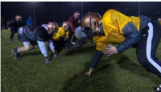
L'équipe des Griffons en entraînement

Pour la première fois de leur jeune histoire, les Griffons de Gaspé atteignent la grande finale de la Ligue scolaire de football juvénile de l'Est du Québec, qui sera présentée demain samedi à Gaspé.