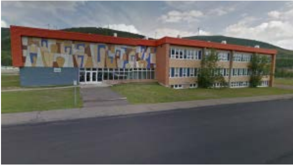
L'école Des Prospecteurs de Murdochville.