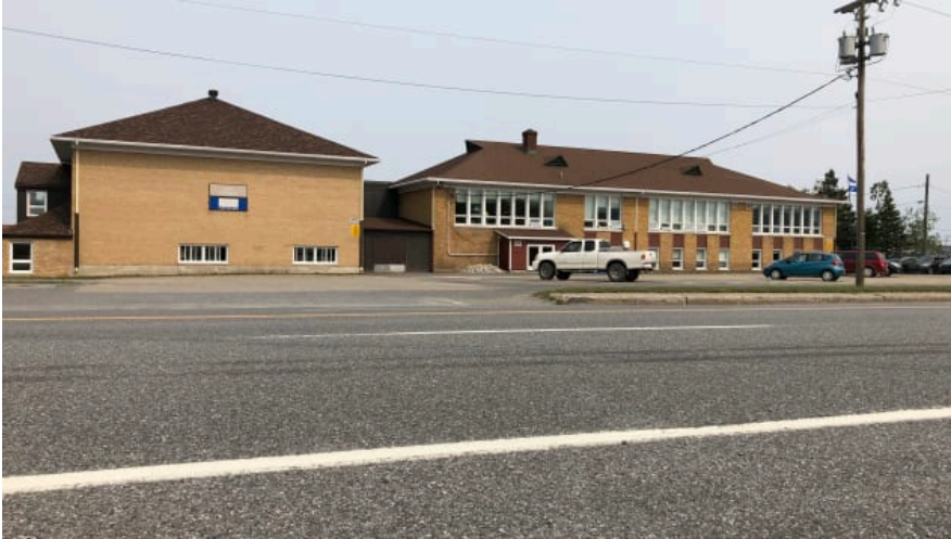
L'École de l'Anse de Sainte-Anne-des-Monts.

Les enfants pourront fréquenter l'école de l'Anse comme prévu.