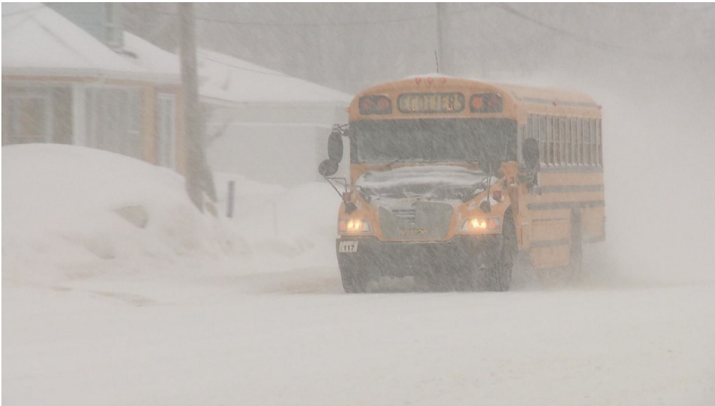
Un autobus scolaire dans la tempête

Un texte de Brigitte Dubé avec les informations de Martin Toulgoat