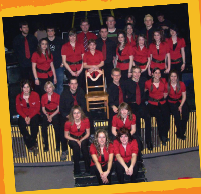
Les élèves de l'école Antoine-Roy qui ont pris part au projet culturel Belles, dormez-vous?

Le 29 juin 2007, devant quelque 900 spectateurs, 200 élèves de la Commission scolaire participent à la Petite École de la chanson chante Daniel Boucher dans le cadre de la 25 e édition du Festival en chanson de Petite-Vallée.