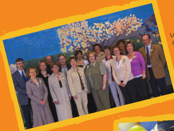
Les 15 personnes honorées lors de la soirée de reconnaissance des 25 ans en éducation