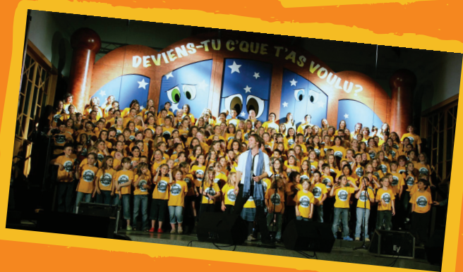
La Petite École de la chanson chante Daniel Boucher