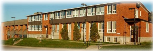
École de l'Escabelle